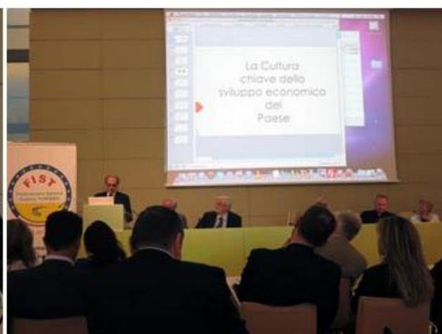
Tavolo dei relatori