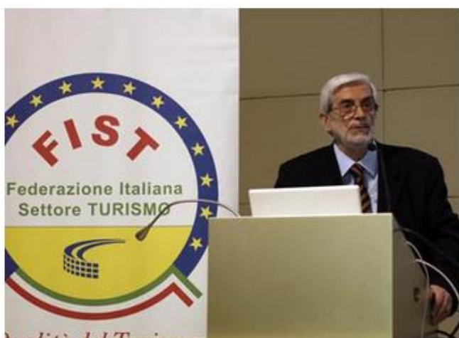
Il Presidente FIST apre i lavori

Lunedì 11 maggio 2015 si è tenuto nell'Aula Magna dell'Università di Modena e Reggio Sede di Reggio il Seminario "La Cultura chiave dello sviluppo economico del Paese" che ha avuto una buona partecipazione ed ha suscitato l'interesse dei partecipanti ed anche quello delle autorità presenti che si sono trattenute fino quasi alla fine. Il seminario si è concluso intorno alle 18,00 con un piccolo rinfresco. Questa conferenza è servita come prima sperimentazione di un processo che vorremmo continuare in altre città italiane al fine di promuovere l'Italia con le sue bellezze naturali, paesaggistiche, enogastronomiche, storiche, artistiche, musicali, uniche al mondo, al fine di allargare le proposte turistiche a gran parte, ma forse a tutte, le città e la provincia italiana. Siamo già in contatto con due regioni del Nord per replicare il convegno e stiamo iniziando a parlare con una terza