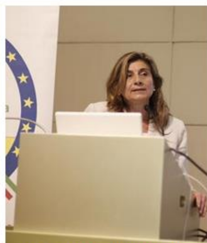
On.le Antonella Incerti, parlamentare PD, membro della XI commissione della Camera